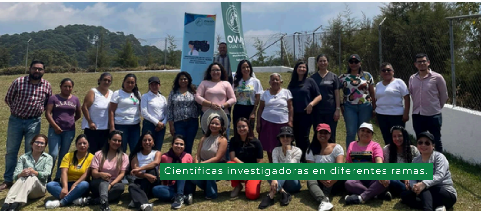
Científicas investigadoras en diferentes ramas.